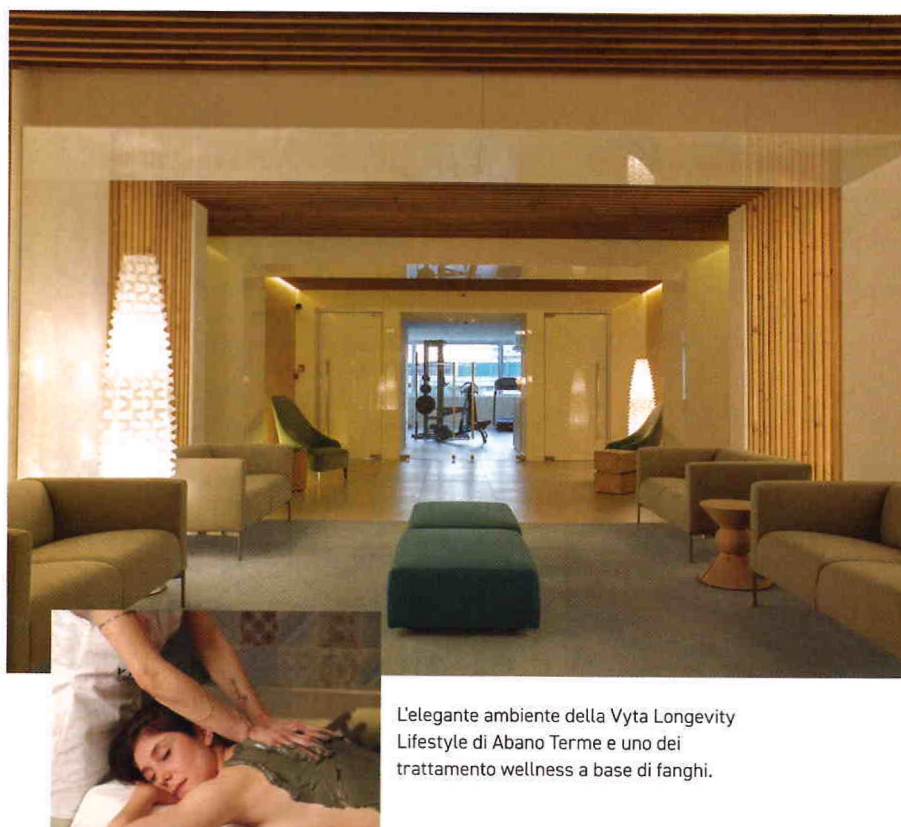
L'elegante ambiente della Vyta Longevity Lifestyle di Abano Terme e uno dei trattamenti wellness a base di fanghi.

Centro dedicato alla longevità, Vyta si trova all'interno dell'Hotel Plaza di Abano Terme, stazione di cure termali nota a livello mondiale. Il suo focus è il potenziamento di salute e benessere attraverso check-up mirati, terapie personalizzate, percorsi antiaging multidisciplinari con la consulenza e vicinanza di esperti e professionisti d'eccellenza in campo medico, medico-estetico, fitness, wellness e alimentare. Tra i protocolli, il Vita Age 360 è quello indicato per potenziare l'organismo e vivere un rapporto più sereno con la propria mente e con l'avanzare del tempo. Dura sette giorni e comprende valutazioni su sistema nervoso autonomo, simpatico e parasimpatico e livello di glicazione correlato al rischio cardiovascolare. Tutto combinato con una serie di trattamenti per il corpo con effetto booster su metabolismo, drenaggio e maggiore produzione di collagene, senza dimenticare il riequilibrio del microbiota cutaneo ( vytalongevity.com ).