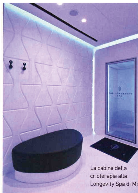
La cabina della crioterapia alla Longevity Spa di Milano

I NUOVI RITUALI DI BENESSERE, COME CRIOTERAPIA E MASSAGGI PER "RINASCERE", SONO ISPIRATI ALLE "ZONE BLU" ABITATE DAI CENTENARI