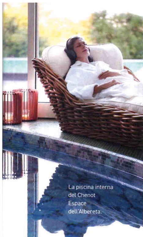
La piscina interna del Chenot Espace dell'Albereta.